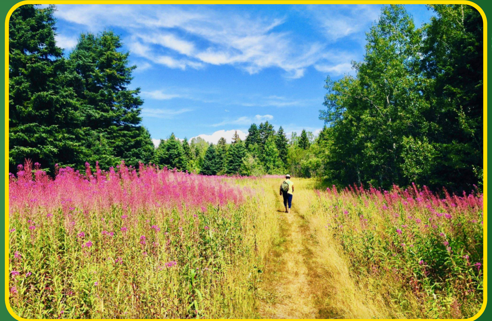
Retour au camp haldimand