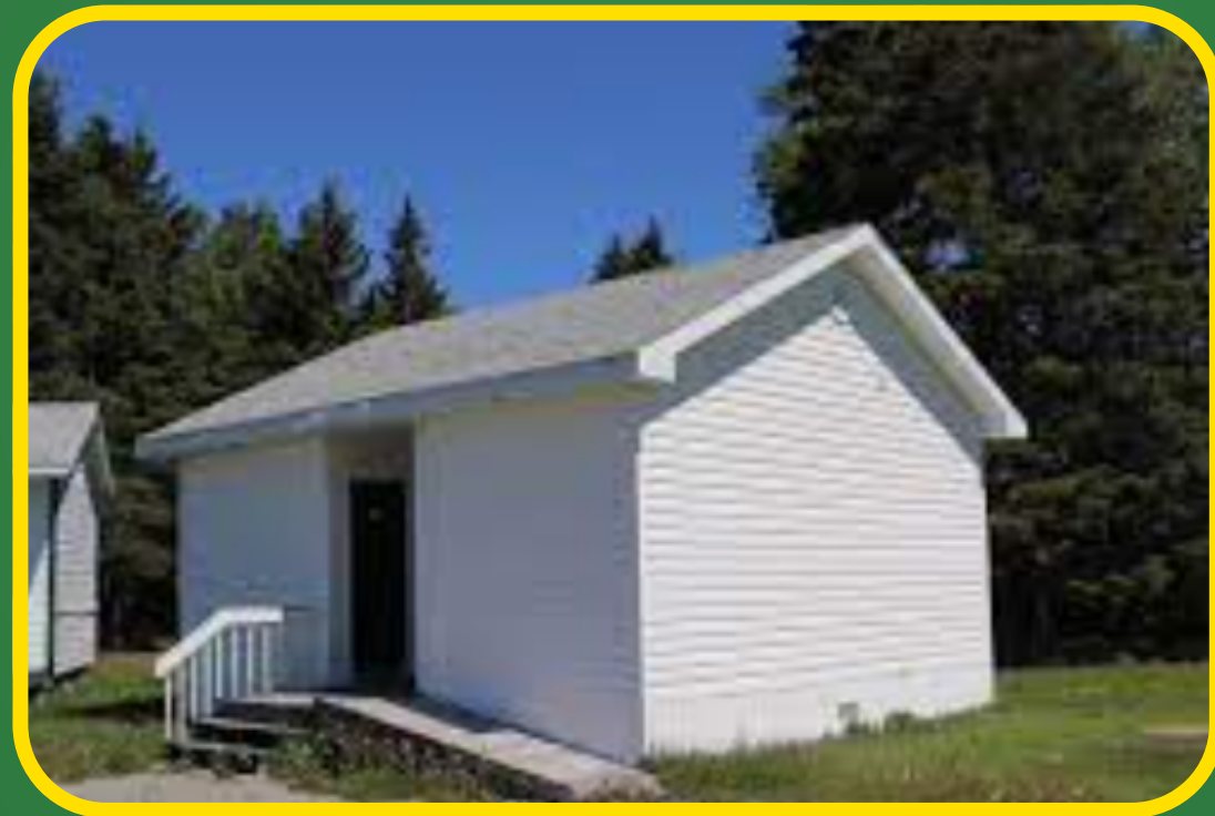
Salles de bain à l'extérieur