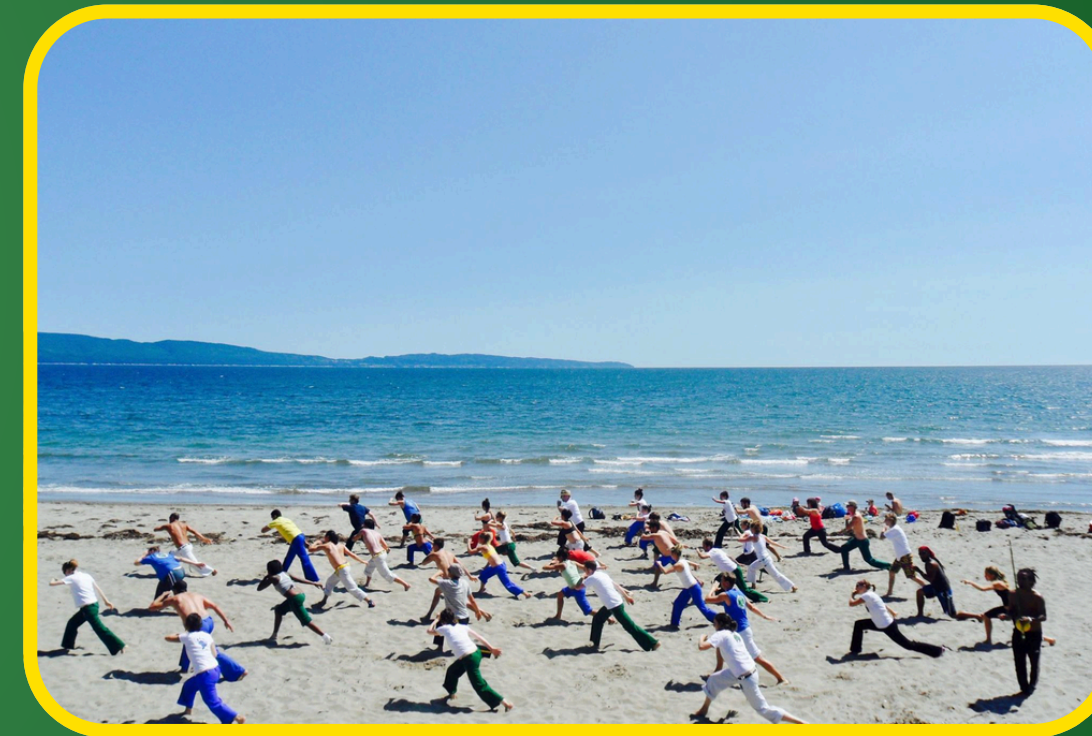
Cours à la plage haldimand