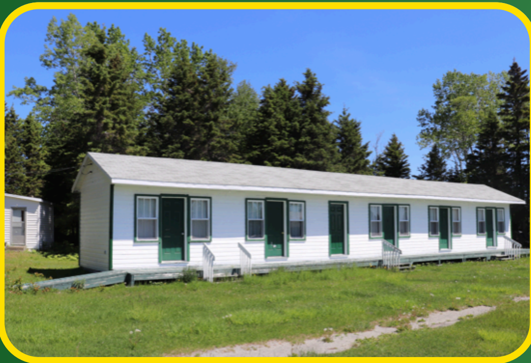
5 cabines style prêt à camper avec 8 lits.