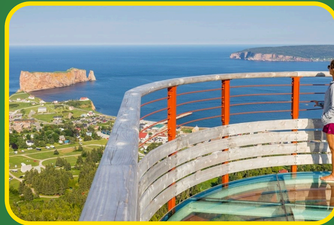
Visite à la Plateforme vitrée suspendue située à 200m d'altitude, qui vous donnera une vue spectaculaire du village de Percé.