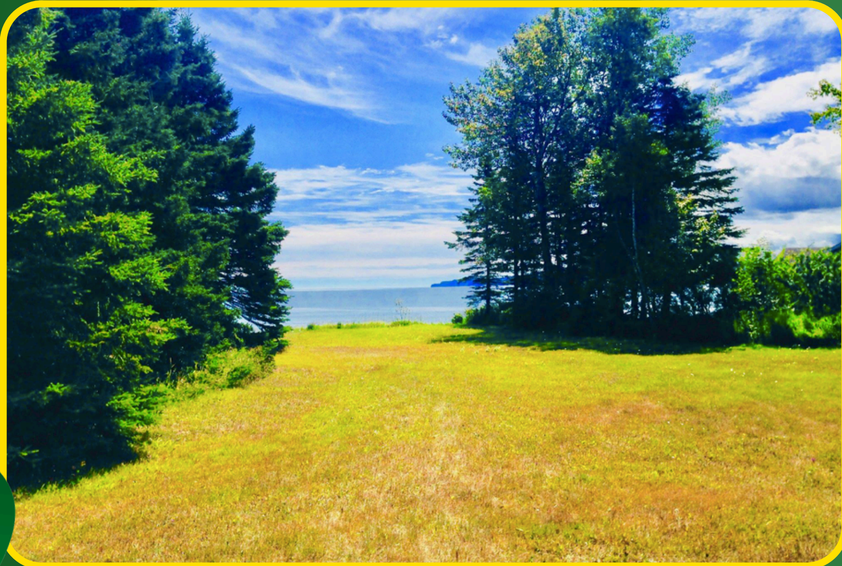
Aller vers la plage haldimand