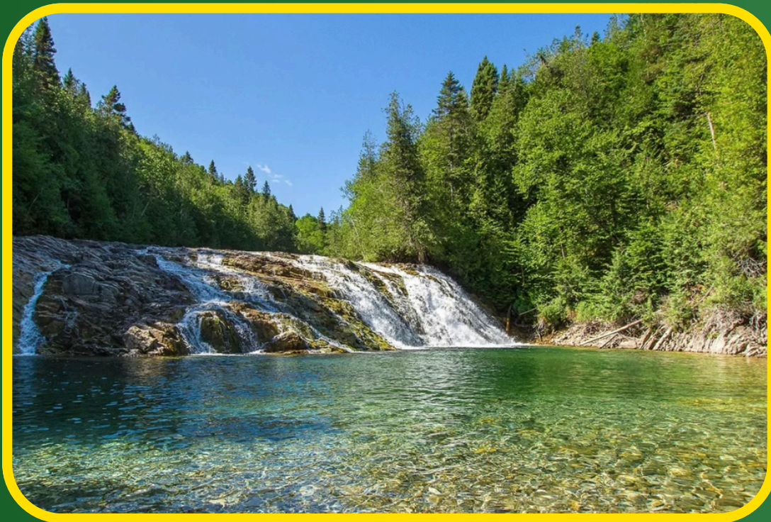
Visite à la rivière aux émeraudes